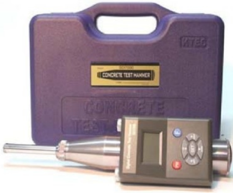
Concrete Test Hammer 정도관리기