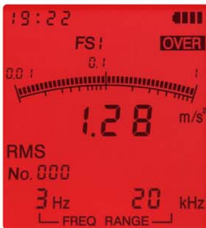
オーバーロード画面