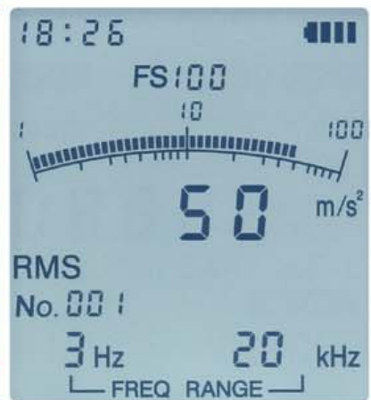
バックライトの点灯