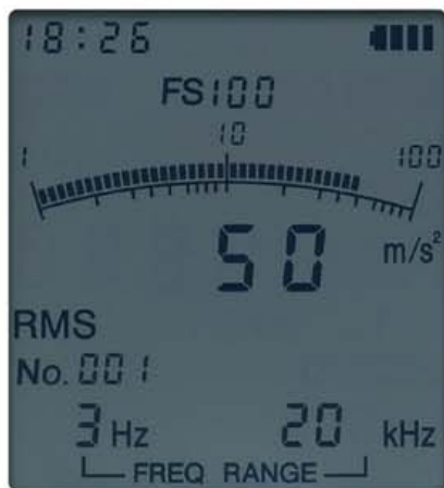
測定データの表示画面

液晶画面にはバーグラフと数値が同時に表示され、変動の様子を容易に把握。設定した周波数範囲などの情報も表示し、バックライト機能により暗所でも内容を確認できます。オーバーロードの状態になると、OVERが表示され、液晶全体が赤色に変わります。